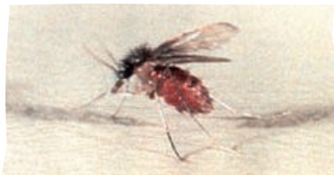
Hembra de Carachai ( Lutzomyia longipalpis ) principal vector de Leishmaniasis visceral en perros y humanos.